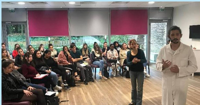
Rennes. Du théâtre contre les idées reçues sur le vieillissement

Théâtre qui invite les spectateurs à participer aux différentes scènes et à chercher des solutions à des situations parfois conflictuelles ou déstabilisantes comme l'entrée en EHPAD, la solitude à domicile