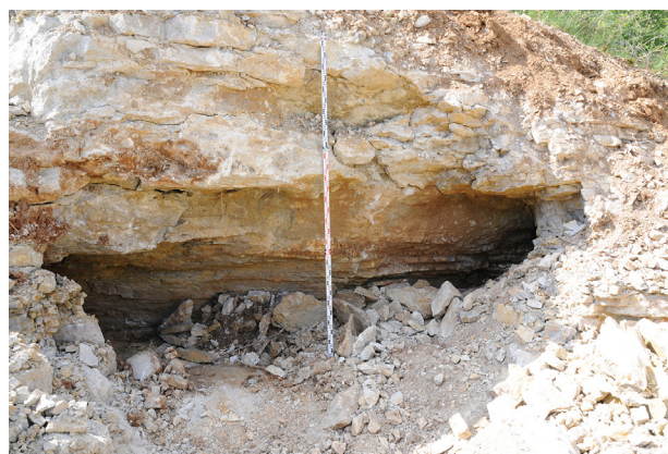
Fig. 1 : La cavité karstique mise au jour lors des travaux de Fontanges à Onet-le-Château.

Lors de l'important décaissement du plateau calcaire au nord de l'étang de Fontanges, une petite cavité karstique inédite a été mise au jour fin mai 2017 (Fig. 1). Située au pied sud-est du plateau et le long de la bordure nord de la nouvelle chaussée, cette modeste grotte n'a pas livré lors de nos visites le moindre indice d'occupation humaine. Orientée sud-ouest - nord-est et mesurant une dizaine de mètres de long sur 1 m à 1,50 m de large, cette cavité naturelle était obstruée par d'importants blocs. On est manifestement à l'extrémité sud-ouest du réseau alors que ce dernier semble se poursuivre vers le nord-est en se rétrécissant.