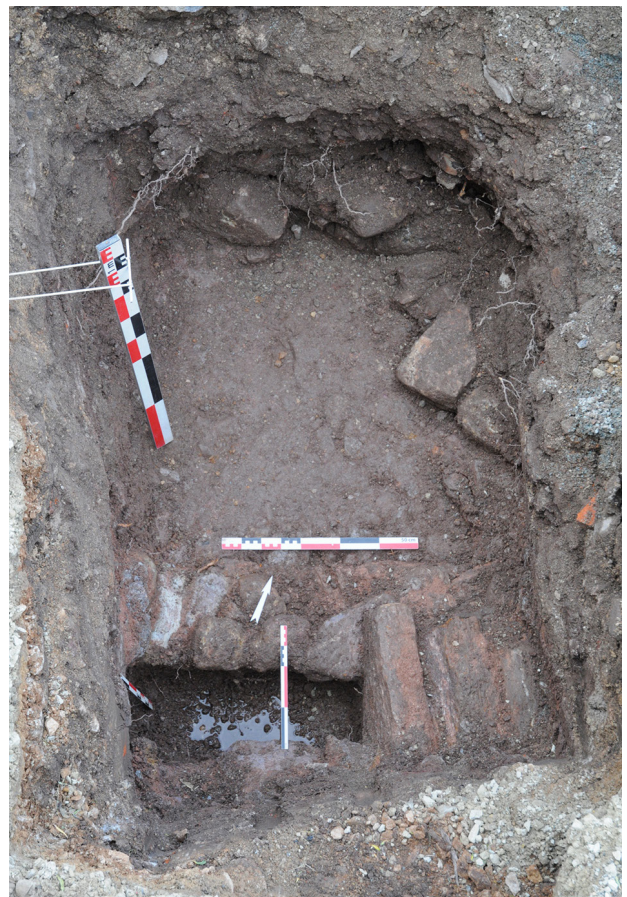
Fig. 4 : Vue des structures mises au jour dans le sondage 9 au collège Fabre à Rodez (cliché Philippe Gruat).

Finalement, peu de vestiges en lien avec le couvent des Annonciades ont été retrouvés, seuls des ossements humains mis au jour dans le secteur de l'église (sondage 1) sont sans doute à relier à cette occupation.