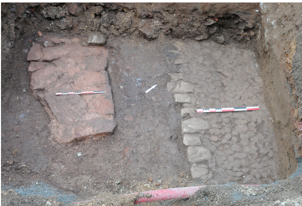
Fig. 3 : Vue des structures mises au jour dans le sondage 8 au collège Fabre à Rodez.

Le sondage 9 a révélé les vestiges les plus anciens de l'opération : un caniveau maçonné servant d'appui à un sol compact et induré correspondant peut-être à une voie (Fig. 3). Les tessons piégés dans ces aménagements permettent d'avancer une datation durant le Haut-Empire. Plus tard, une maçonnerie de pierre sèche est venue s'installer sur ce niveau de circulation, sans que l'on puisse en déterminer la chronologie exacte. L'orientation de ce mur semblerait l'inscrire dans la trame urbaine orthonormée du Haut-Empire, avec un décalage de 22° E par rapport au nord. Du moins, elle diverge de l'alignement des murs de bâtiments médiévaux et/ou modernes mis au jour dans d'autres sondages mais aussi de la canalisation et du niveau de voirie antérieurs. Ce dernier serait l'un des axes les plus septentrionaux de Segodunum (Rodez). En effet, les vestiges bâtis attestés dans la ville antique sont généralement plus au sud tandis que notre secteur est occupé par des sites plutôt funéraires.