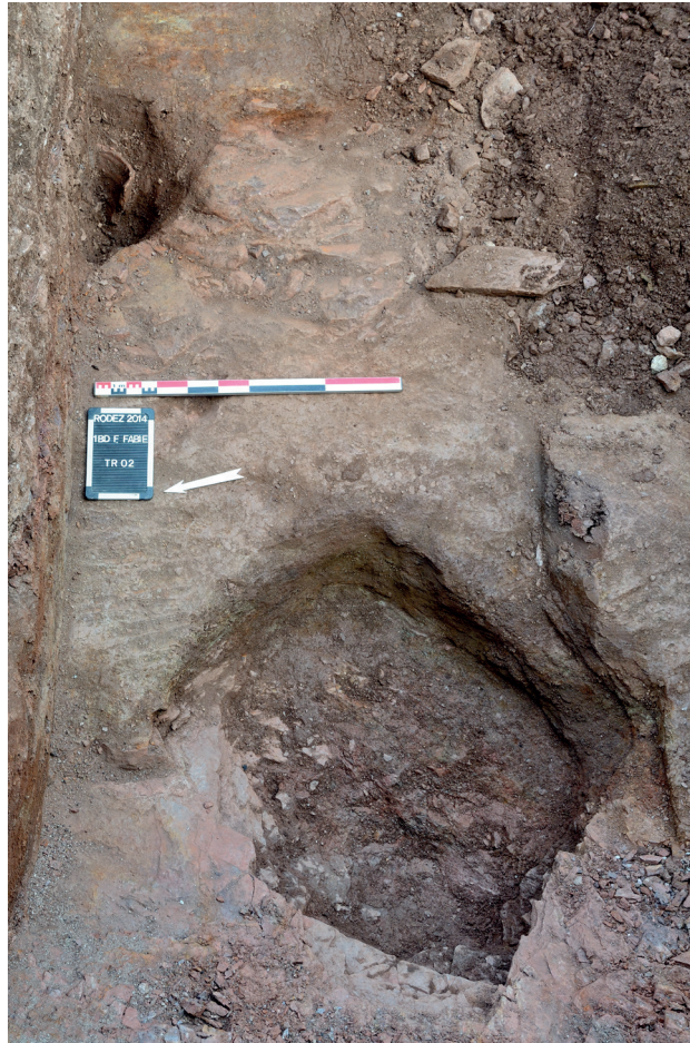
Fig. 2 : Rodez, 1 boulevard François Fabié. Fosses de la fin de l'âge du Fer (fin II e / début I er s. av. J.-C.) découvertes à la base de la tranchée 2.