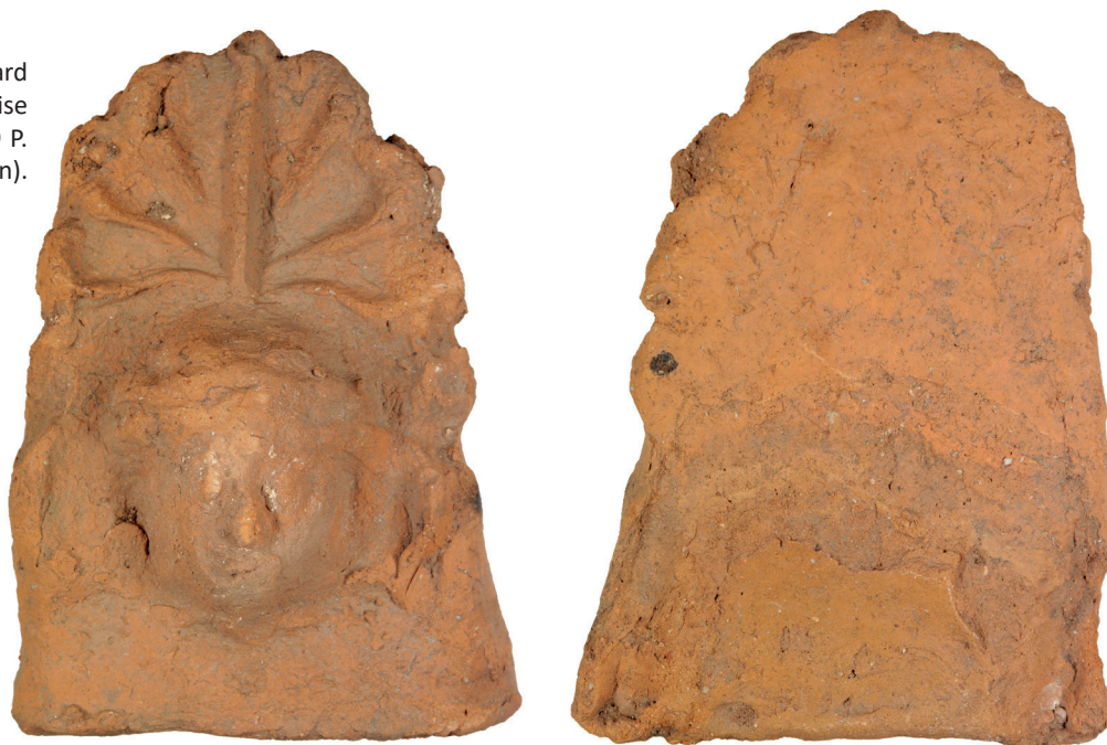
Fig. 3 : Rodez, 1 boulevard François Fabié. Antéfixe mise au jour dans l'u.s. 8005 (© P. Lagarrigue, SDA de l'Aveyron).