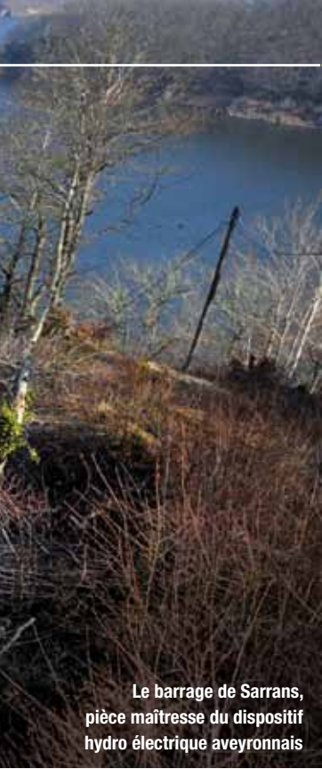
Le barrage de Sarrans, pièce maîtresse du dispositif hydro électrique aveyronnais