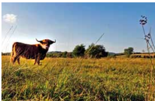
La tourbière des Rauzes

A quelques encablures du Mont Seigne se trouve un autre des lieux remarquables du Lévézou : la tourbière de la plaine des Rauzes. Elle fait partie du réseau des espaces naturels sensibles qui appartiennent au Conseil général et qui sont ouverts au public. Elle est un bon exemple de la richesse que représentent les zones humides, longtemps considérées comme terrains perdus et bonnes à drainer. Dans cette tourbière, plus de cent espèces végétales ont été recensées dont douze sont rares et menacées ; parmi elles figurent la Droséra à feuilles rondes et la Petite utriculaire. Il en est de même de la faune avec la grenouille rousse, le papillon Azuré des mouillères, la libellule Agrion de Mercure, le hibou des marais... Grâce à un très large partenariat, l'entretien du site a été confié à un troupeau d'Highland cattle tandis qu'un sentier de découverte pédagogique a été aménagé.