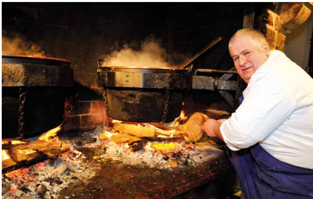
Feu de bois et chaudron de cuivre