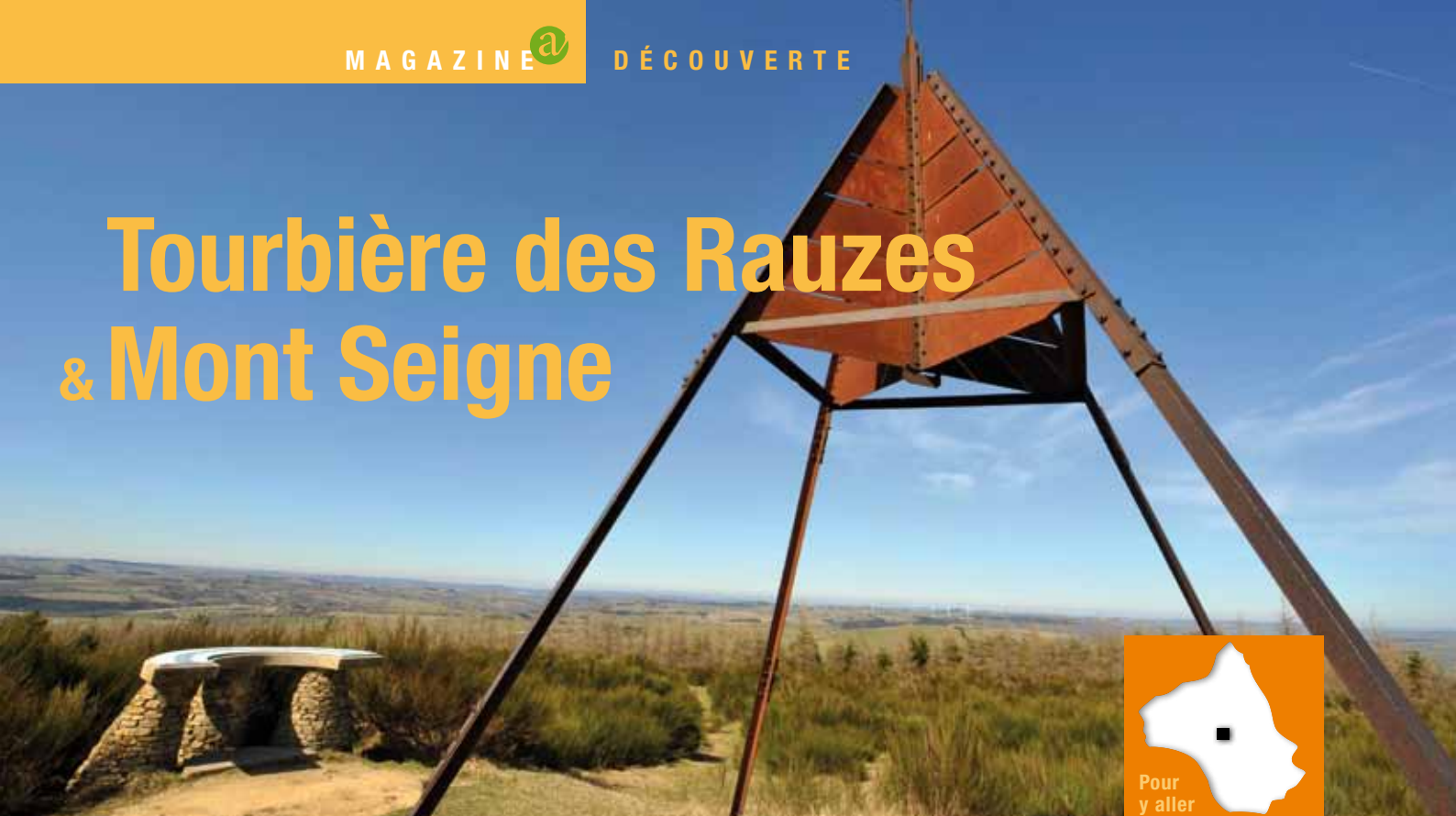
Panorama à 360° depuis le Mont Seigne