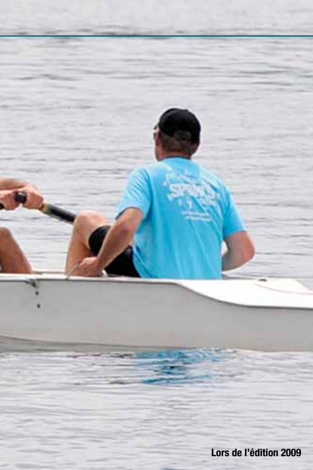
Lors de l'édition 2009