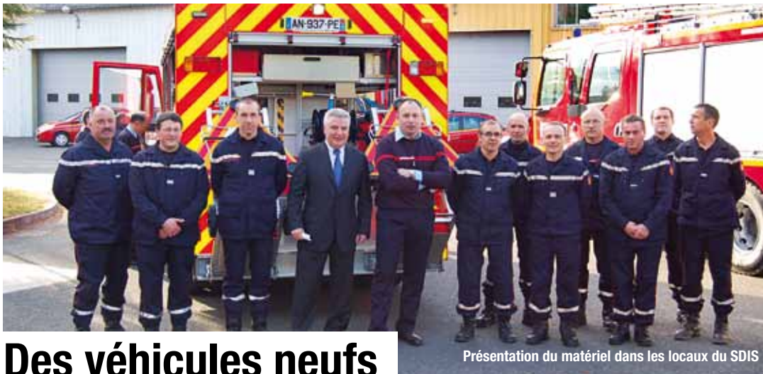
Présentation du matériel dans les locaux du SDIS