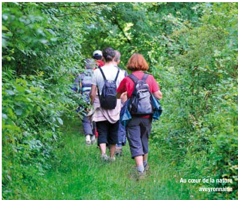
Au cœur de la nature aveyronnaise

Cette inscription est la condition nécessaire pour prétendre à une labellisation Qualité Aveyron qui suppose de répondre à des critères très stricts. La via ferrata de Liaucous a été labellisée.