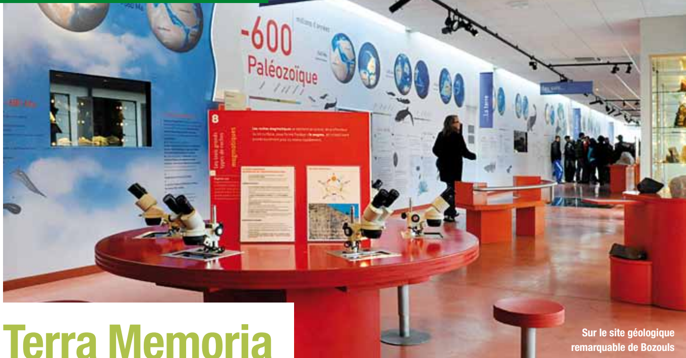
Sur le site géologique remarquable de Bozouls