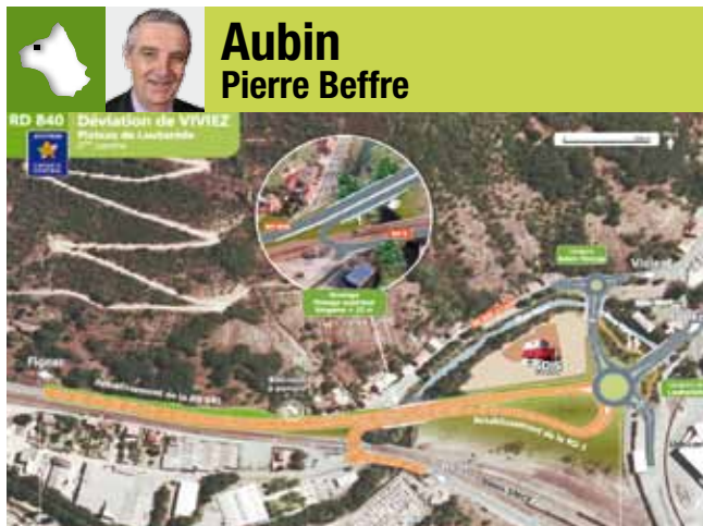
Aubin Pierre Beffre