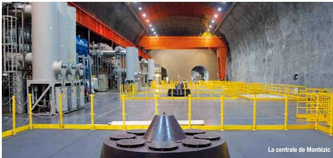
La centrale de Montézic

Un groupe de travail composé des principaux partenaires est appelé à se réunir pour réfléchir sur ces deux points.