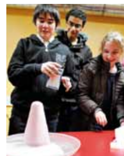
Visite et ateliers

Dans cette échelle-là ramenée à notre jour de 24 heures, l'homme apparaît... à la dernière seconde.