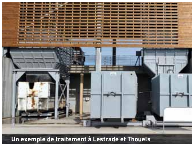
Un exemple de traitement à Lestrade et Thouels

Faut-il ou non créer un nouveau centre de tri ? Comment traiter les déchets qui ne pourront pas être recyclés ou valorisés ? Quelles actions mettre en place en priorité afin de diminuer les quantités de déchets produits ? Combien de déchèteries nouvelles doit-on prévoir ?