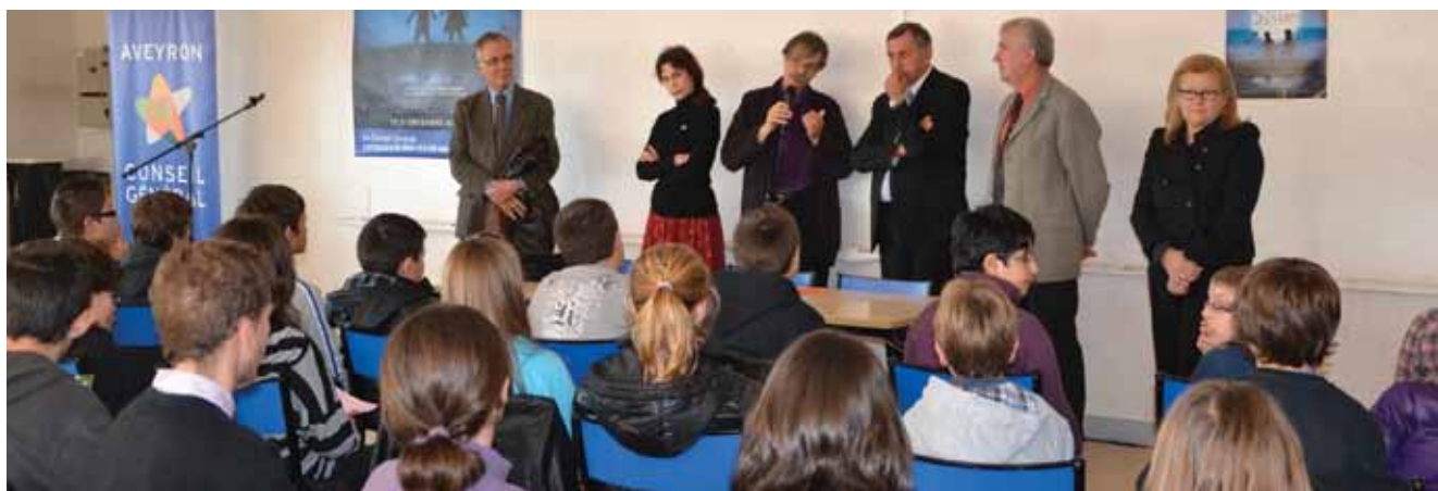
Rencontre avec les réalisateurs au collège Jean Moulin à Rodez