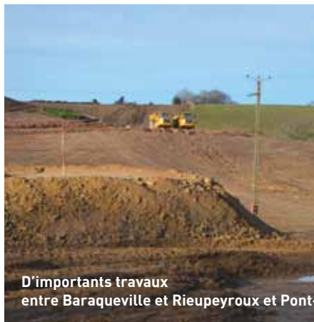
D'importants travaux entre Baraqueville et Rieupeyroux et Pont-de-Grandfuel et Cassagnes-Bégonhès

la RD 902, qui relie le Réquistanais et le sud-ouest du département (cantons de St-Sernin, Belmont, Camarès notamment) à Rodez, supporte un trafic de 1 600 véhicules par jour, dont quelque 150 poids lourds. De gros aménagements y ont été réalisés, notamment dans le secteur de Bonnetcombe. La partie entre Pont-de-Grandfuel et Cassagnes-Bégonhès, très sinueuse, va maintenant faire l'objet d'un aménagement important, d'un montant total de 4 M€.