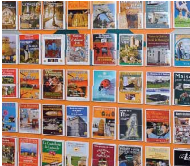
Le présentoir du Club des sites