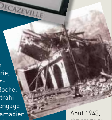
Aout 1943, dynamitage du puits central des mines de Decazeville