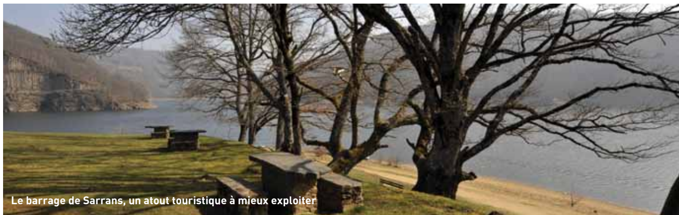
Le barrage de Sarrans, un atout touristique à mieux exploiter