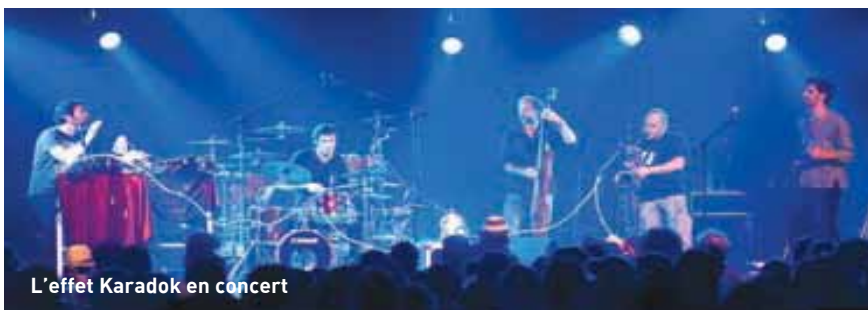
L'effet Karadok en concert

Un voyage, donc, qui, côté public, séduit aussi bien les jeunes que ceux pour qui les références à Genesis, Franck Zappa et King Crimson illustrent une incontestable liberté musicale. Côté projet, il y a dans l'air l'idée de travailler avec des images, autour d'une esthétique à la Georges Méliès, le milieu forain avec ses affiches extravagantes... Toujours, donc, un univers « ludique » fait de « patchwork et de télescopage ».