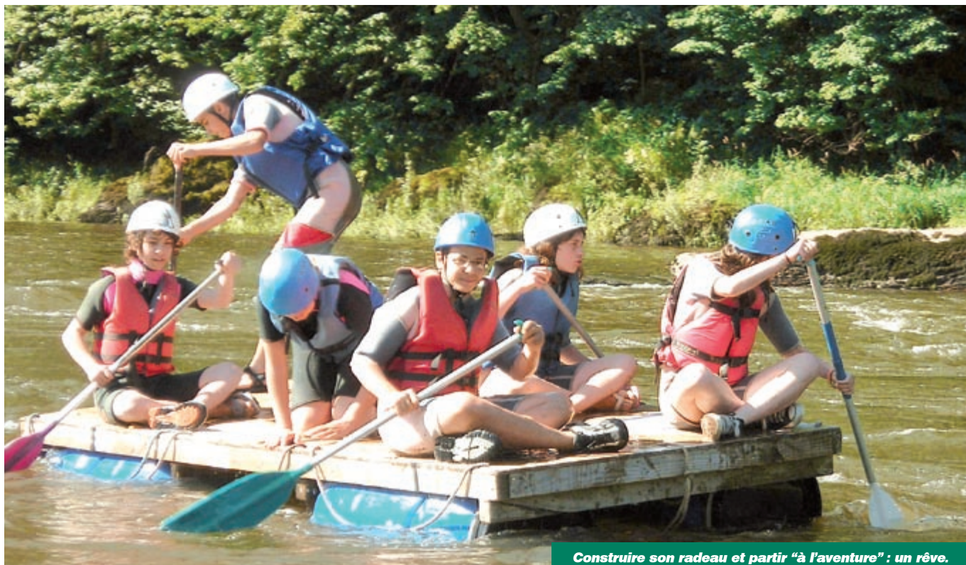
Construire son radeau et partir "à l'aventure" : un rêve.

Être en pleine forme pour la rentrée, partager en famille un séjour "exotique" et profiter de l'eau du Lot dans tous ses états : trois idées qui ont permis à l'ADALPA (association départementale des activités de loisirs et de plein-air) d'élaborer de nouveaux produits pour cette année 2008.