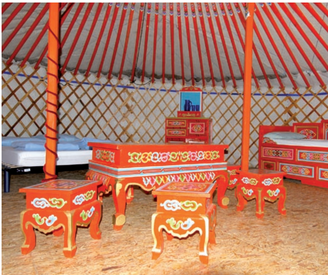
En famille, sous la yourte : l'une des nouvelles formules proposées.

De plus, fidèle à son approche environnementale du milieu dans lequel elle organise ses activités, l'ADALPA donne à vivre tous les aspects de l'eau du Lot de Saint-Geniez-d'Olt à Entraygues avec “Big splash” , mitonné pour les 9/11 ans. La richesse de la rivière se décline de diverses manières : la nature, le