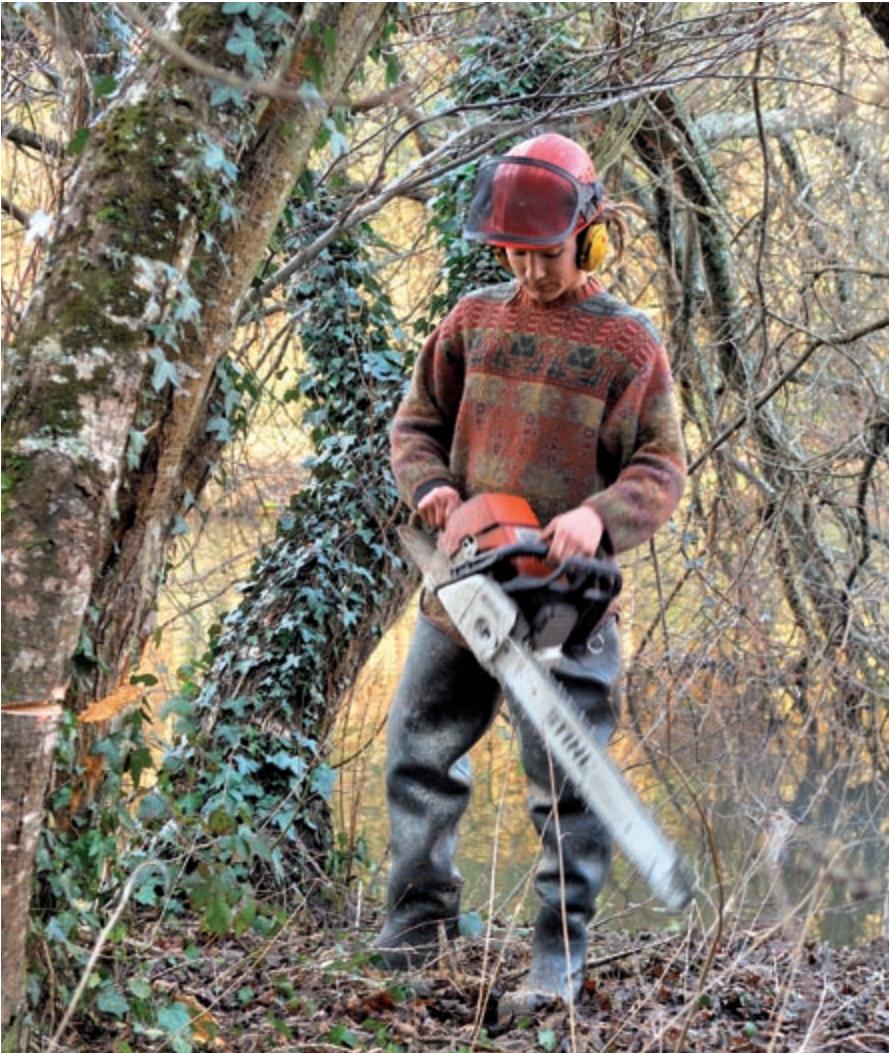
L'entretien est notamment assurée par une équipe du Contrat de Rivière Viaur.

Les objectifs poursuivis par le Contrat de Rivière Viaur peuvent ainsi être résumés : mieux prendre en compte les exigences écologiques des différentes espèces. Cela signifie par exemple que lorsqu'il est envisagé de retirer les arbres morts échoués dans le lit d'un cours d'eau, il n'est pas inutile de se demander s'ils ne sont pas intéressants pour certaines espèces d'oiseaux qui y nichent ; et dans ce cas, un compromis peut être trouvé, en laissant quelques-uns de ces arbres. Cette démarche consiste à "recréer de la biodiversité". Bocage, marécages, gorges, tourbières... Tous ces milieux sont à préserver. Appliqué très concrètement sur le terrain, cela concerne notamment des travaux routiers tels ceux liés au contournement de Pont-de-Salars. Une zone tourbeuse et une plante rare ont entraîné une modification du tracé initialement prévu.