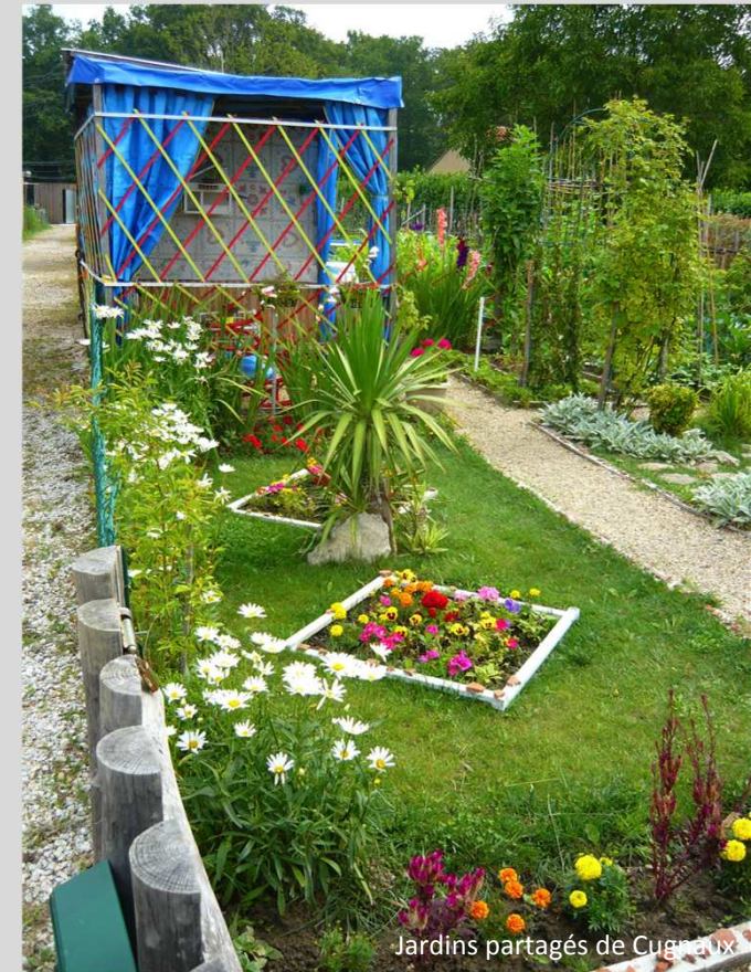
Jardins partagés de Cugnon