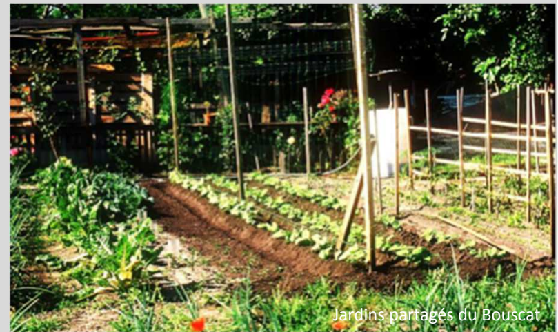
Jardins partagés du Bouscat