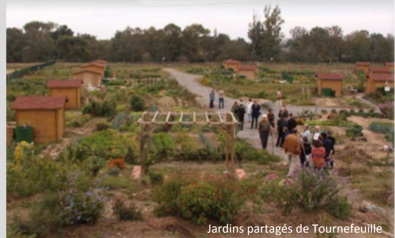
Jardins partagés de Tournefeuille

* Ces jardins ne sont pas automatiquement partagés dans le sens premier de discutés