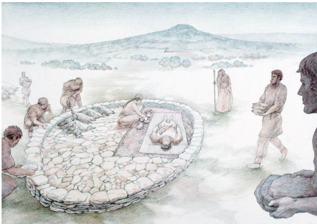
Évocation du tumulus 1 de Roumagnac à Sévérac-le-Château, Aveyron (aquarelle de P.-Y. Videlier)