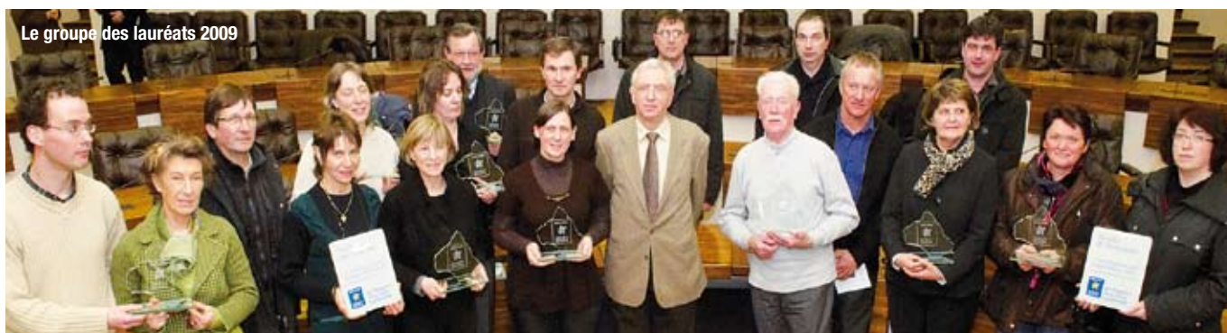
Le groupe des lauréats 2009

Restauration du patrimoine, rénovation et adaptation du patrimoine, création contemporaine, mise en sécurité du patrimoine mobilier : tous les lauréats le disent : le prix départemental du patrimoine, avec ces quatre catégories, leur permet de recevoir une reconnaissance financière mais surtout morale du travail – souvent colossal – qu'ils ont accompli.