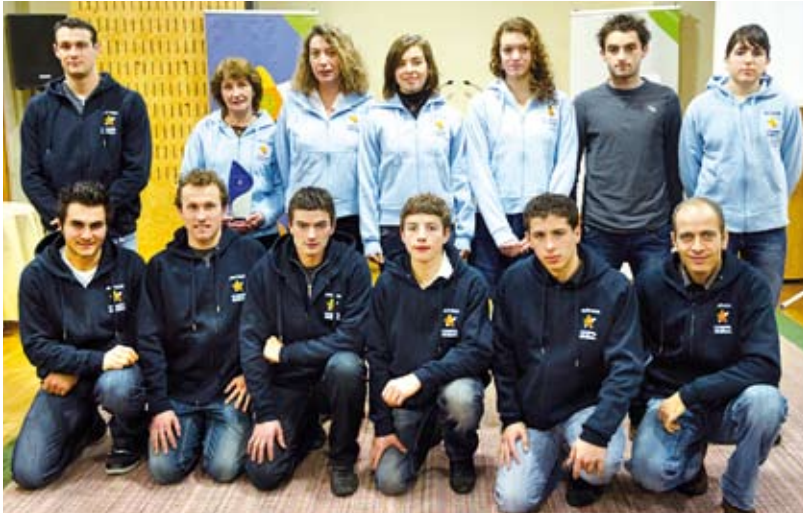
L'élite aveyronnaise soutenue par le Conseil général

Au titre de la saison 2009-2010, le Conseil général a accompagné 19 sportifs et 10 clubs de sports individuels de haut niveau.