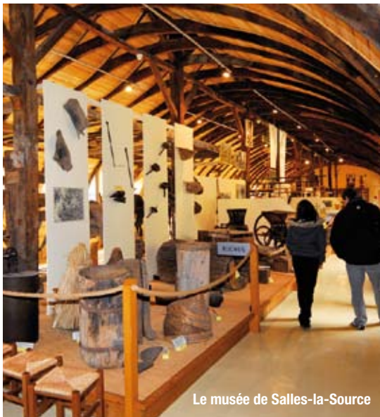
Le musée de Salles-la-Source

La nuit des musées est une manifestation nationale prévue le 15 mai et à laquelle participent les musées de Salles-la-Source et Montrozier avec un succès certain : quelque 500 visiteurs à Montrozier en 2009. Le principe : accueillir le public durant la nuit en proposant un programme festif et ludique. A Salles-la-Source, on découvrira les collections à la lampe-torche, à la manière d'un jeu de piste et en musique. A Montrozier, à l'occasion de l'inauguration de l'exposition sur l'art pariétal (lire ci-dessous), on pourra profiter d'ateliers de BD avec des auteurs, participer à un concours de dessin, à un jeu de piste et dîner de mets originaux dans le parc du château.