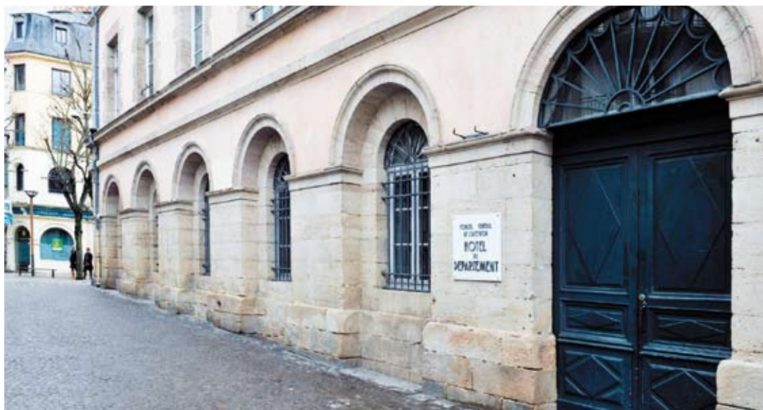
La gestion du patrimoine immobilier départemental au cœur de la réflexion