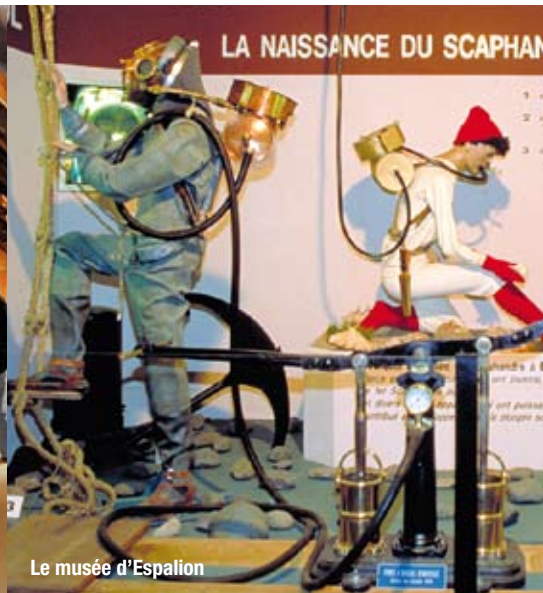
Le musée d'Espalion