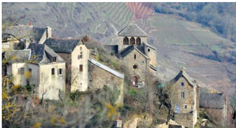
La sentinelle de Cassagnes-Comtaux

Depuis Clairvaux d'Aveyron, pour aller à Panat : emprunter la route qui monte vers Nuces ; pour aller à Cassagnes-Comtaux, emprunter celle qui mène à Goutrens.