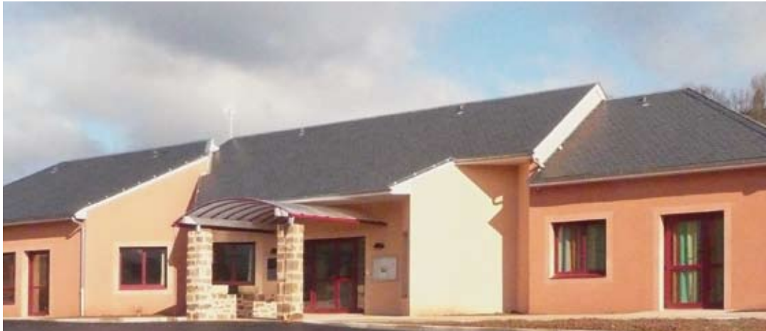
L'école de Clairvaux a été inaugurée le 29 janvier