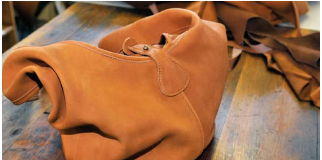
La production du Sac du Berger est fondée sur des matériaux de très grande qualité