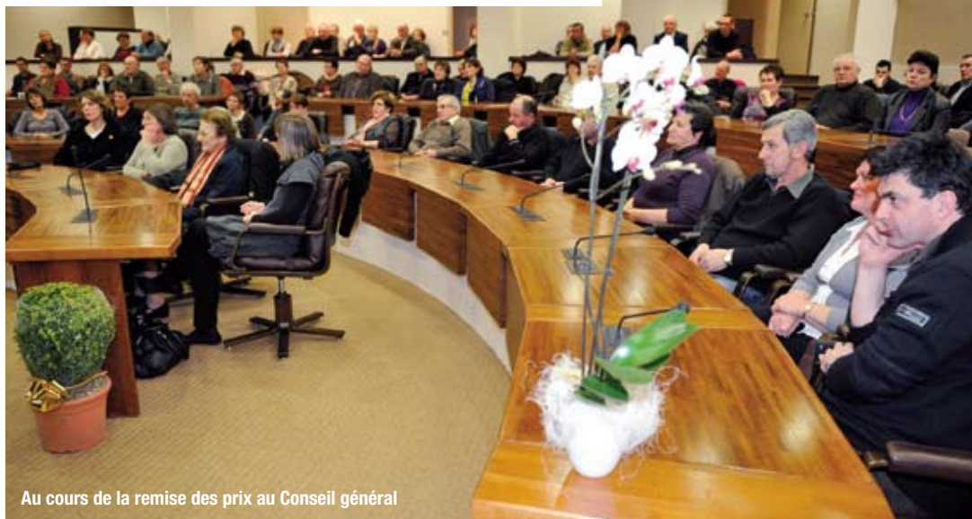
Au cours de la remise des prix au Conseil général

Palmarès complet sur le site internet du Conseil général : www.cg12.fr