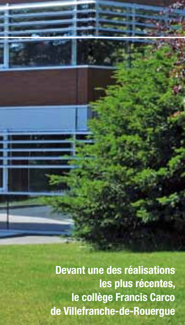
Devant une des réalisations les plus récentes, le collège Francis Carco de Villefranche-de-Rouergue