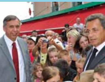
Sur le marché de Mur-de-Barrez

Il y avait 77 ans (en 1933 avec Albert Lebrun pour l'inauguration du barrage de Sarrans) que le Carladez n'avait pas eu la visite d'un Président de la République. Le déplacement de Nicolas Sarkozy, jeudi 1 er juillet, s'est déroulé sur le thème de l'agriculture de montagne avec visite d'une ferme sur le territoire de la commune de Brommat, débat, présentation des produits locaux. Le chef de l'État, accompagné des ministres de l'intérieur et de l'espace rural, Brice Hortefeux et Michel Mercier, s'est ensuite rendu sur la place de Mur-de-Barrez, reçu par le maire et son conseil municipal. Là, M. Sarkozy a pu rencontrer la population au marché des producteurs de pays. La troisième étape présidentielle a été pour les gendarmes, à la brigade de Mur-de-Barrez et au déjeuner qui a suivi, gendarmes auxquels il a exprimé sa confiance pour le travail accompli sur les territoires.