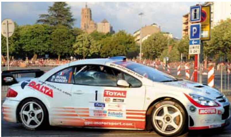
Un énorme succès populaire

Canivenq, sans monture compétitive et de surcroît contraint à l'abandon.