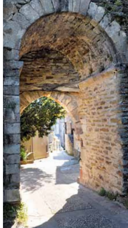
Tout le charme de la bastide sous le regard du château