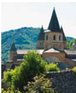
Conques, atout touristique majeur

C'est la raison pour laquelle la cave coopérative de Valady, bien placée en bordure de la RD 840, veut jouer la carte œnologique. Parmi les projets, la construction d'un nouveau caveau plus esthétique et plus fonctionnel.