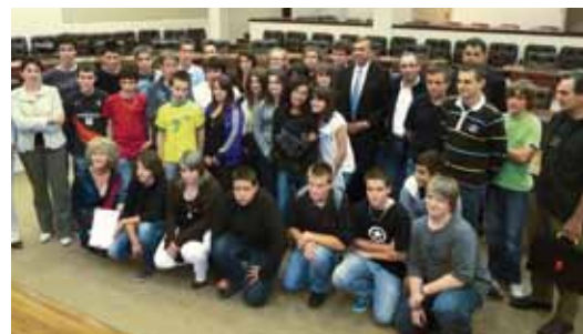
Les lauréats récompensés

À la fin de l'année scolaire, les documents comportant des éléments de synthèse basés sur les visites et complétés de réponses à un certain nombre de questions, ont été examinés et les meilleurs « pass-