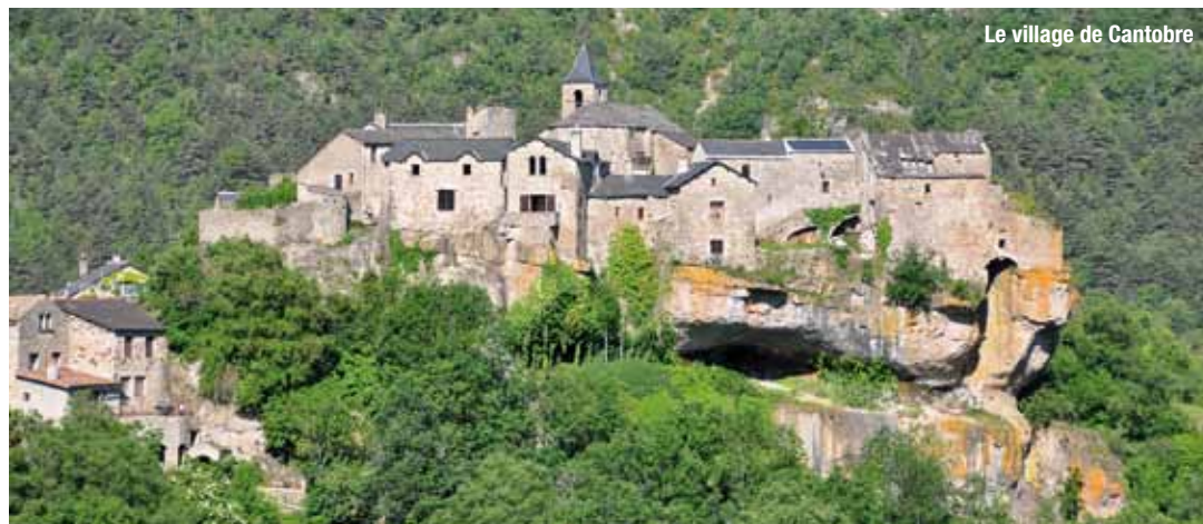
Le village de Cantobre

Le développement touristique a été l'un des points forts de la réunion qu'a tenue le président du Conseil général avec les élus des cantons de Nant et de Cornus, sur fond d'explication du budget.