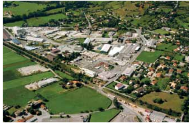
La zone des Gravasses

Le projet de contournement sud de Villefranche-de-Rouergue a franchi une nouvelle étape avec la présentation de diverses possibilités de tracés. Aux élus concernés de formuler maintenant leurs remarques.