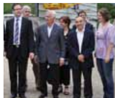
Sur le chantier de la déchèterie de Saint-Rome-de-Tarn

ce territoire constitue également un bon témoignage des atouts dont peut jouer la ruralité pour s'inscrire dans une démarche de développement.