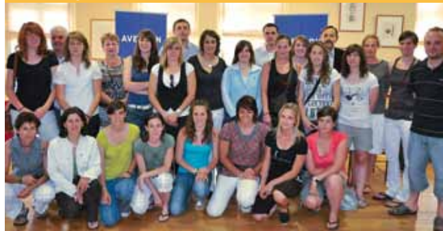
La réception au Conseil général