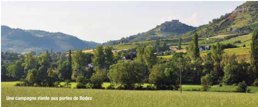
Une campagne riante aux portes de Rodez