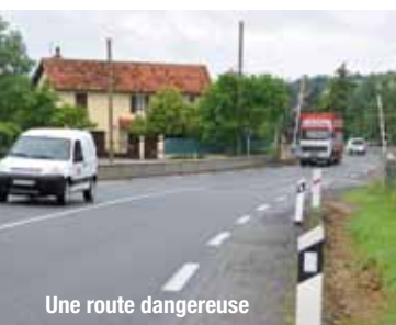
Une route dangereuse

Le Conseil général a proposé d'être maître d'ouvrage de tronçons comme Sévérac-Recoules ou le barreau de Saint-Mayme près de Rodez (un investissement de l'ordre de 50 M € pour chaque section) afin de débloquer la situation. Il attend la réponse.