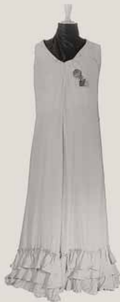
Robe pour Carmen

© Musée de Millau, Photo Pierre Plattier