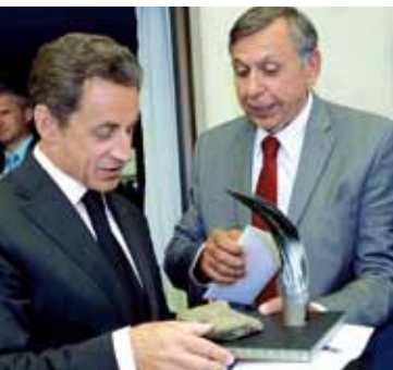
Un souvenir aveyronnais pour Nicolas Sarkozy

Il y avait 77 ans (en 1933 avec Albert Lebrun pour l'inauguration du barrage de Sarrans) que le Carladez n'avait pas eu la visite d'un Président de la République. Le déplacement de Nicolas Sarkozy, jeudi 1 er juillet, s'est déroulé sur le thème de l'agriculture de montagne avec visite d'une ferme sur le territoire de la commune de Brommat, débat, présentation des produits locaux. Le chef de l'État, accompagné des ministres de l'intérieur et de l'espace rural, Brice Hortefeux et Michel Mercier, s'est ensuite rendu sur la place de Mur-de-Barrez, reçu par le maire et son conseil municipal. Là, M. Sarkozy a pu rencontrer la population au marché des producteurs de pays. La troisième étape présidentielle a été pour les gendarmes, à la brigade de Mur-de-Barrez et au déjeuner qui a suivi, gendarmes auxquels il a exprimé sa confiance pour le travail accompli sur les territoires.