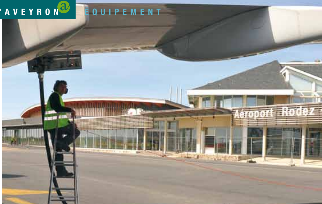
Une nouvelle aérogare