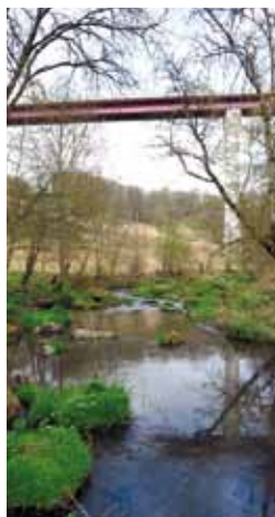
Le viaduc à 55 m au-dessus du Viaur

Ainsi, quelque 3 kilomètres de haies sont créés le long du contournement, ce qui représente environ 4 200 plants, essentiellement des essences