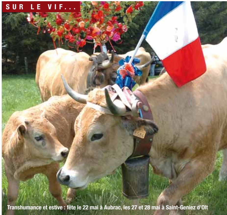
Transhumance et estive : fête le 22 mai à Aubrac, les 27 et 28 mai à Saint-Geniez d'Olt