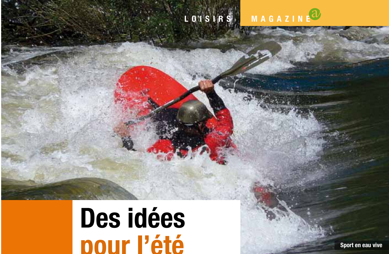
Sport en eau vive