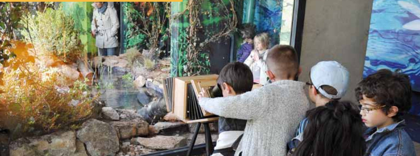
La mare naturelle de Micropolis