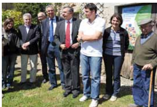
Sur une exploitation de Sainte-Radegonde