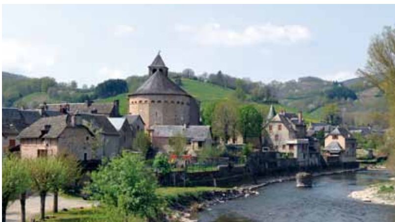
Sainte-Eulalie-d'Olt sur les bords du Lot

Par ailleurs, le fait d'être groupé autorise une meilleure force de vente. Ainsi, une association a été créée, baptisée la Grange des arts. Elle édite une plaquette de promotion des artisans et organise des événements dans le village, en mai (Senteurs et saveurs) et en octobre (Au détour des matières). « Cela permet de montrer qu'on est là même hors saison estivale » commente le tourneur sur bois.