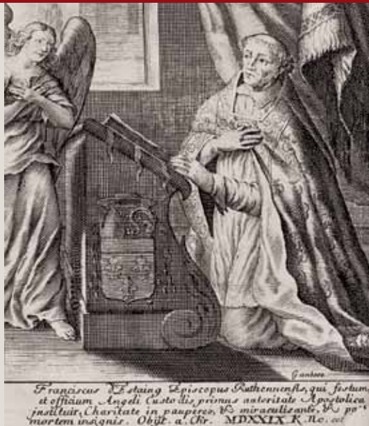
Portrait de François-d'Estaing (Société des Lettres)