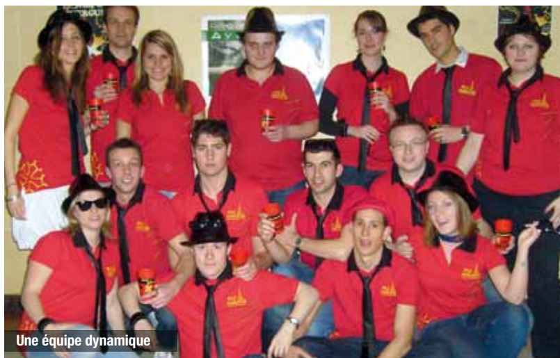
Une équipe dynamique

Incontournable pour dissiper un coup de blues ou faire découvrir l'ambiance aveyronnaise : un restaurant tenu par des Aveyronnais. Ils sont répertoriés sur le site internet suivant : www.miammiam12.com