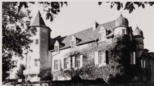
Le château de Labro, édifié par la famille de Créato au début du XVI e

La conférence inaugurale, consacrée à la peinture française du XVII e siècle et sa redécouverte aux XIX e et XX e siècles, sera prononcée par Pierre Rosenberg, de l'Académie française, président directeur général honoraire du musée du Louvre, le 9 juin à 21h à Rodez. Renseignements : Société des Lettres, 05 65 42 75 93 ; soc.lettres.aveyron@orange.fr