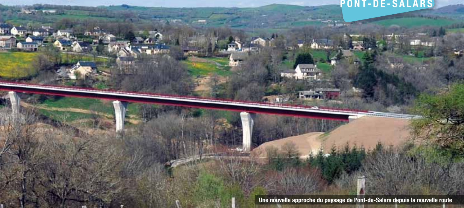
Une nouvelle approche du paysage de Pont-de-Salars depuis la nouvelle route