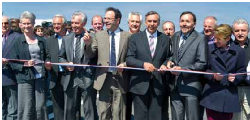
Une inauguration avec personnalités et collégiens