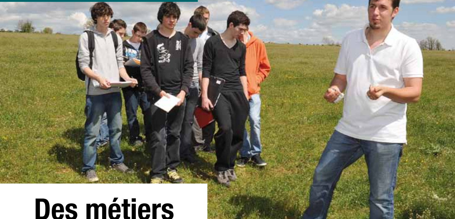
L'agriculture expliquée aux jeunes Aveyronnais