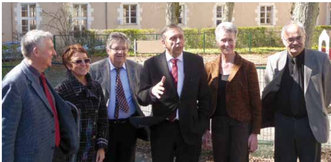
Visite des élus et des responsables de l'ADAPEAI sur le site