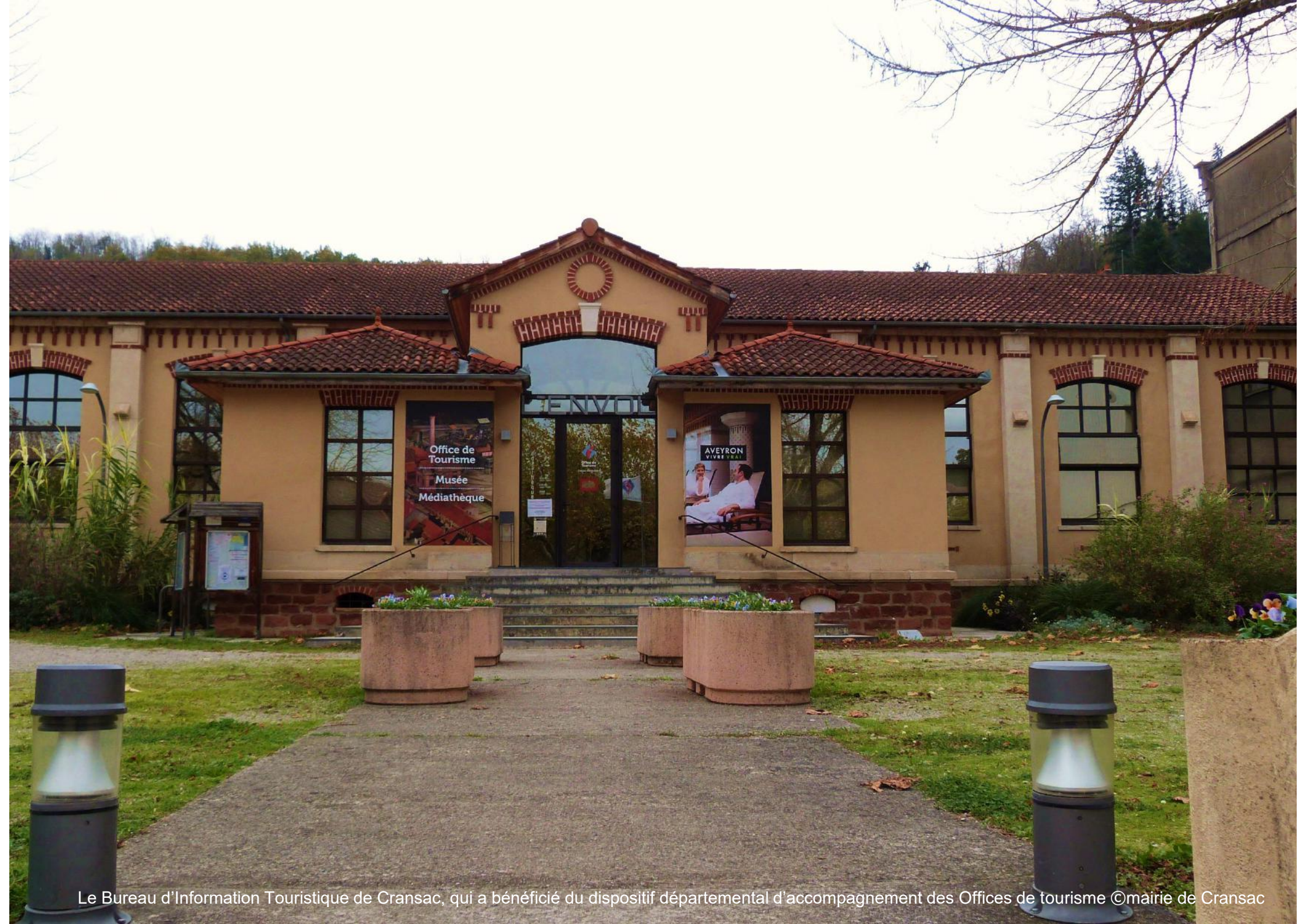
Le Bureau d'Information Touristique de Cransac, qui a bénéficié du dispositif départemental d'accompagnement des Offices de tourisme