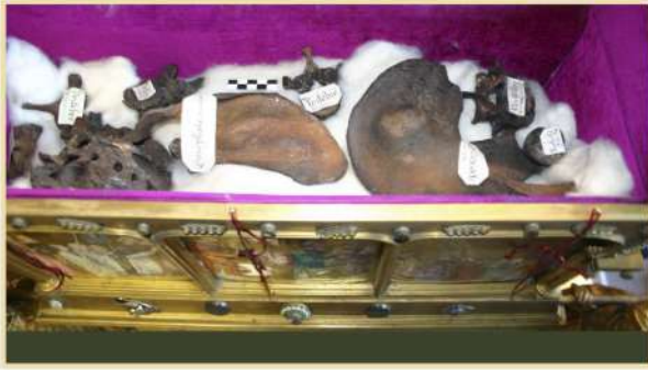
Ouverture de la châsse de saint Fleuret en vue de l'étude anthropologique des restes humains et de leur datation, église d'Estaing