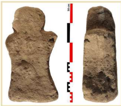
Buste gaulois découvert près de la chapelle de Saint-Cyrice de l'Ifernet, commune du Truel