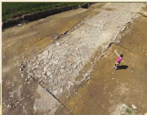
La voie de la Lande Basse en cours de démontage, Baraqueville (fouille ACTER archéologie 2017)