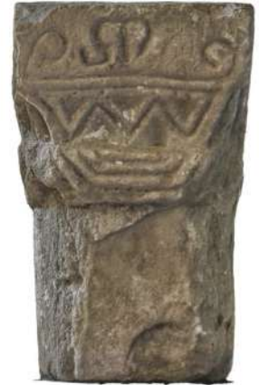
Chapiteau vraisemblablement carolingien de l'église d'Amalou au Viala-du-Tarn.