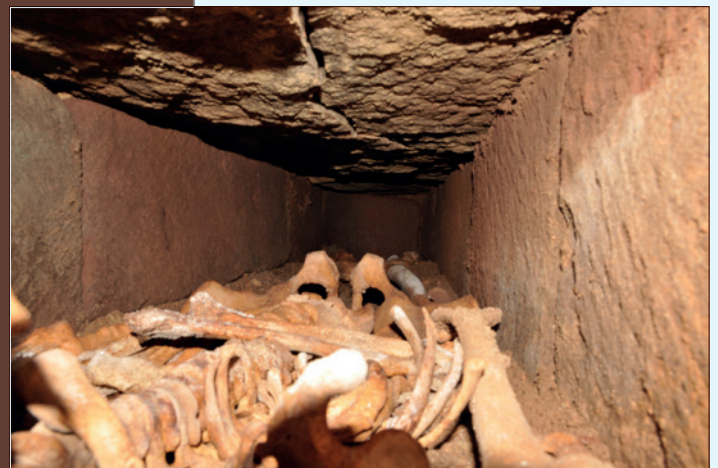
Volume intérieur de la sépulture