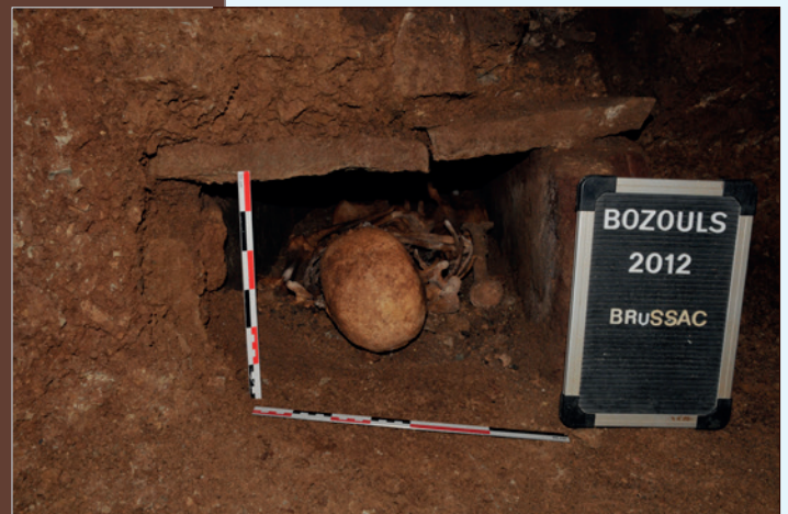
Sépulture après enlèvement de la logette céphalique