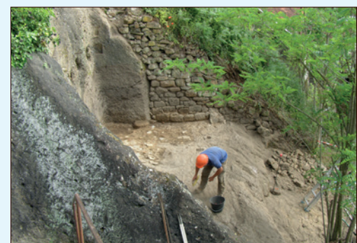
Case-encoche en cours de fouille