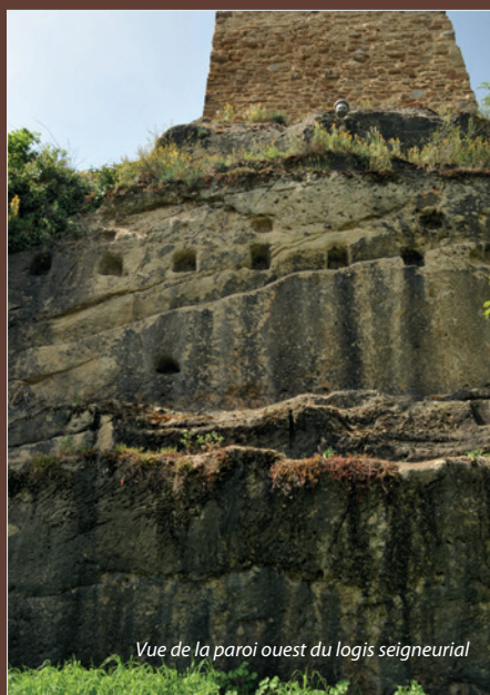
Vue de la paroi ouest du logis seigneurial

Le premier consistait à effectuer un relevé de la paroi rocheuse