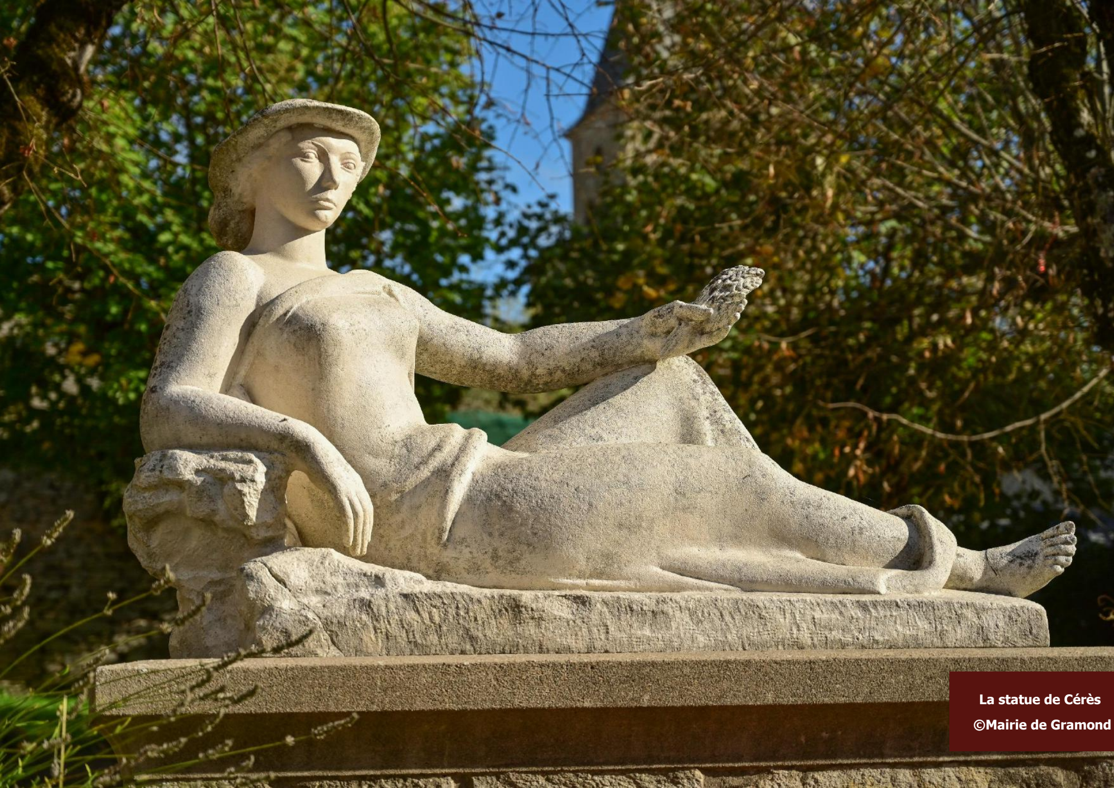
La statue de Cérés