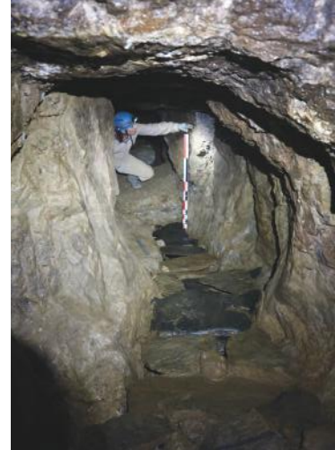
Fouille de la mine de Cantamerle au Minier