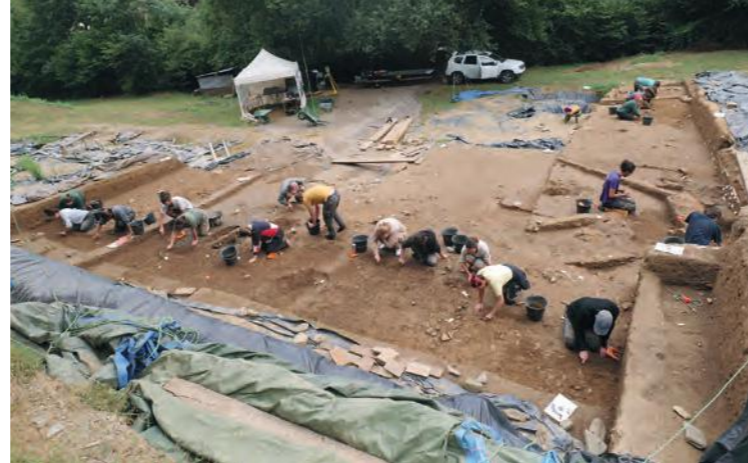
La fouille de l'atelier métallurgique du Planet durant la campagne 2024

Conservateur régional de l'archéologie (DRAC Occitanie)