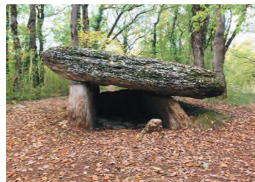
Dolmen du bois del Rey à Martiel