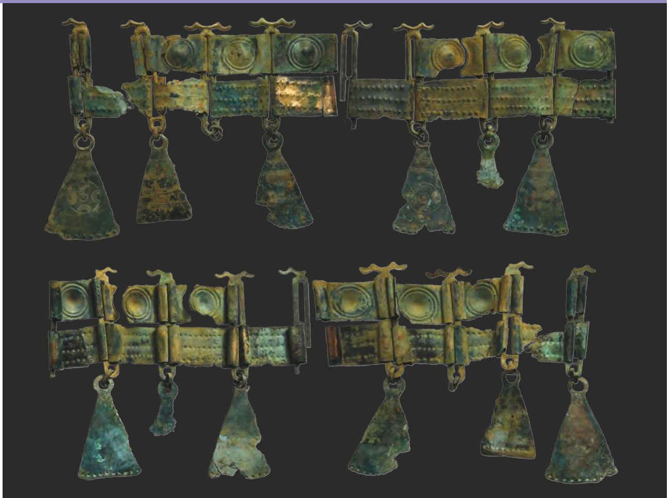
Ceinture articulée en bronze découverte près d'Estaing