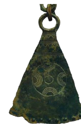
Détail d'un des pendentifs de la ceinture de Sébrazac