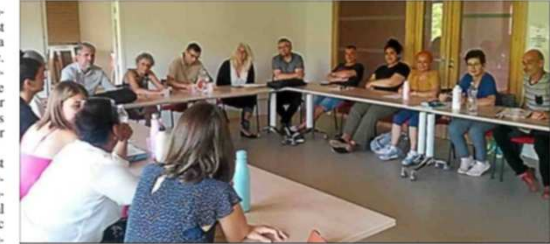
Une formation innovante a été délivrée par le Greta.

Le premier constat est positif car, comme chacun l'a souligné « aucun des neuf participants n'a décroché de cette formation très dense qui a abordé des sujets parfois difficiles comme celui de la fin de vie, mais aussi l'accompagnement des personnes en